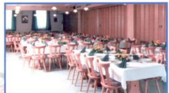
Immer gemütlich: Der Nebenraum und in der Gaststube

Ob Hochzeiten, Jubiläen oder Tagungen - auf große Gesellschaften sind wir bestens vorbereitet, räumlich und personell. Wir sorgen für den passenden Rahmen, gutes Essen und zuvorkommenden Service.